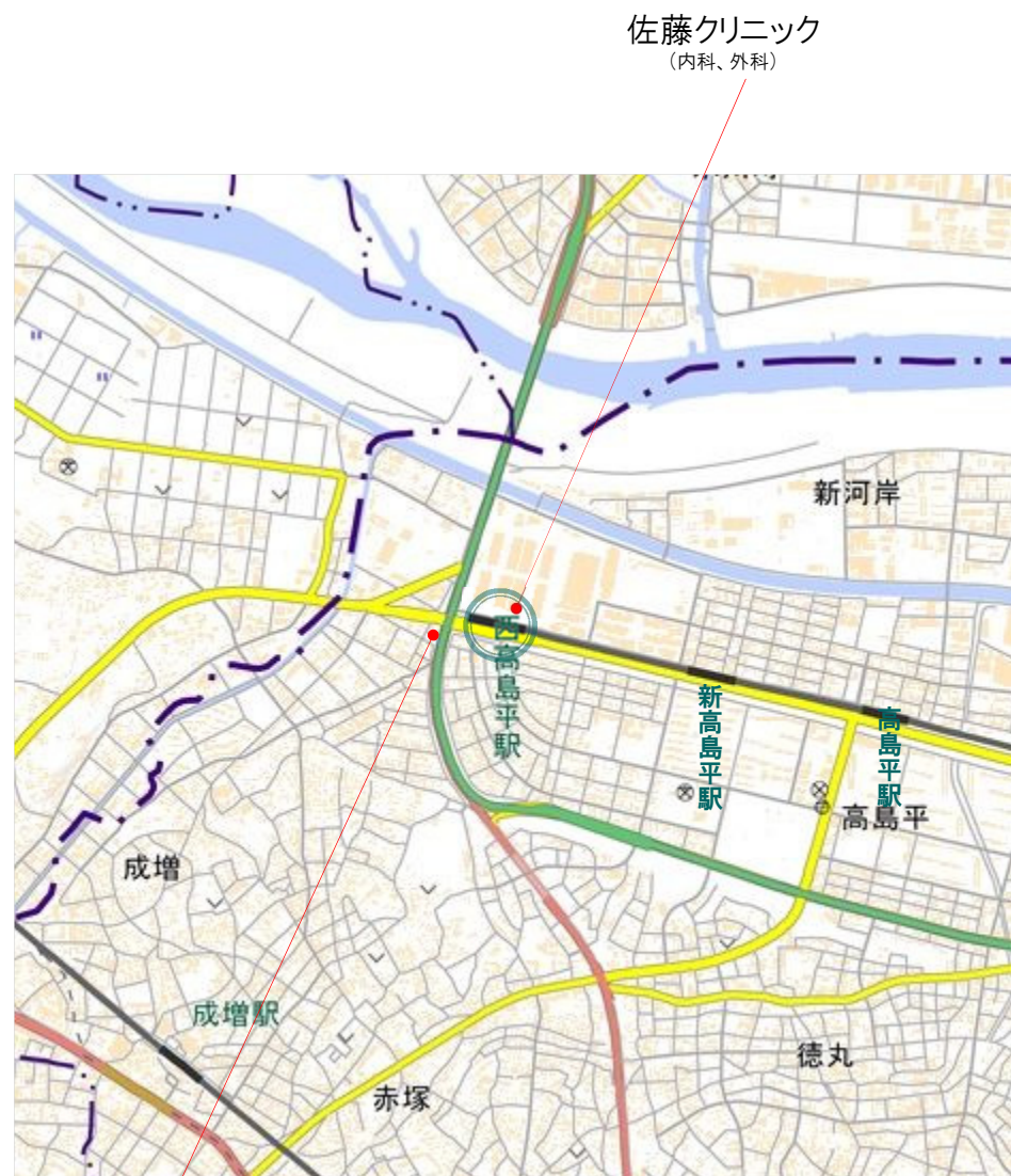
木村整形外科 (整形外科)