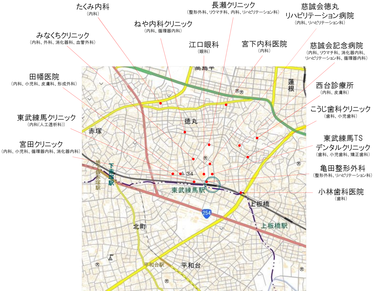
国土地理院の電子地形図(タイル)に連携医療機関の位置情報を追記して掲載しております