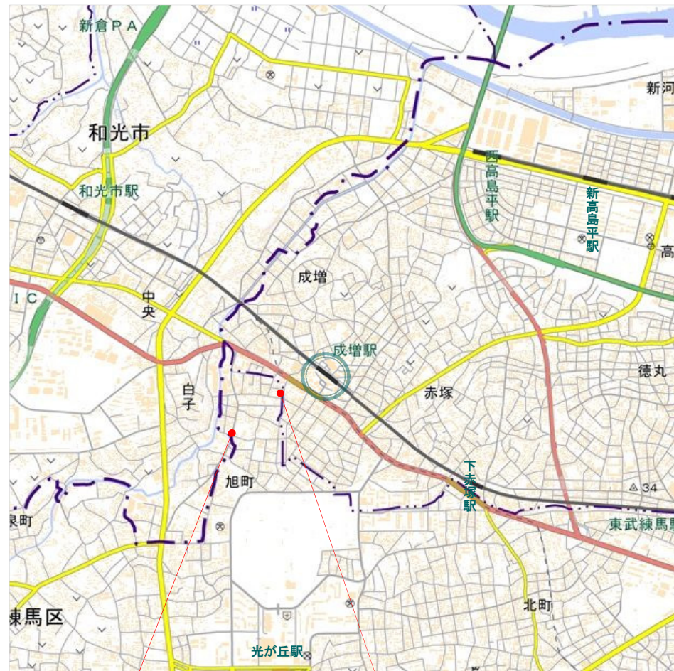
ナカムラ歯科 (歯科、小児歯科)