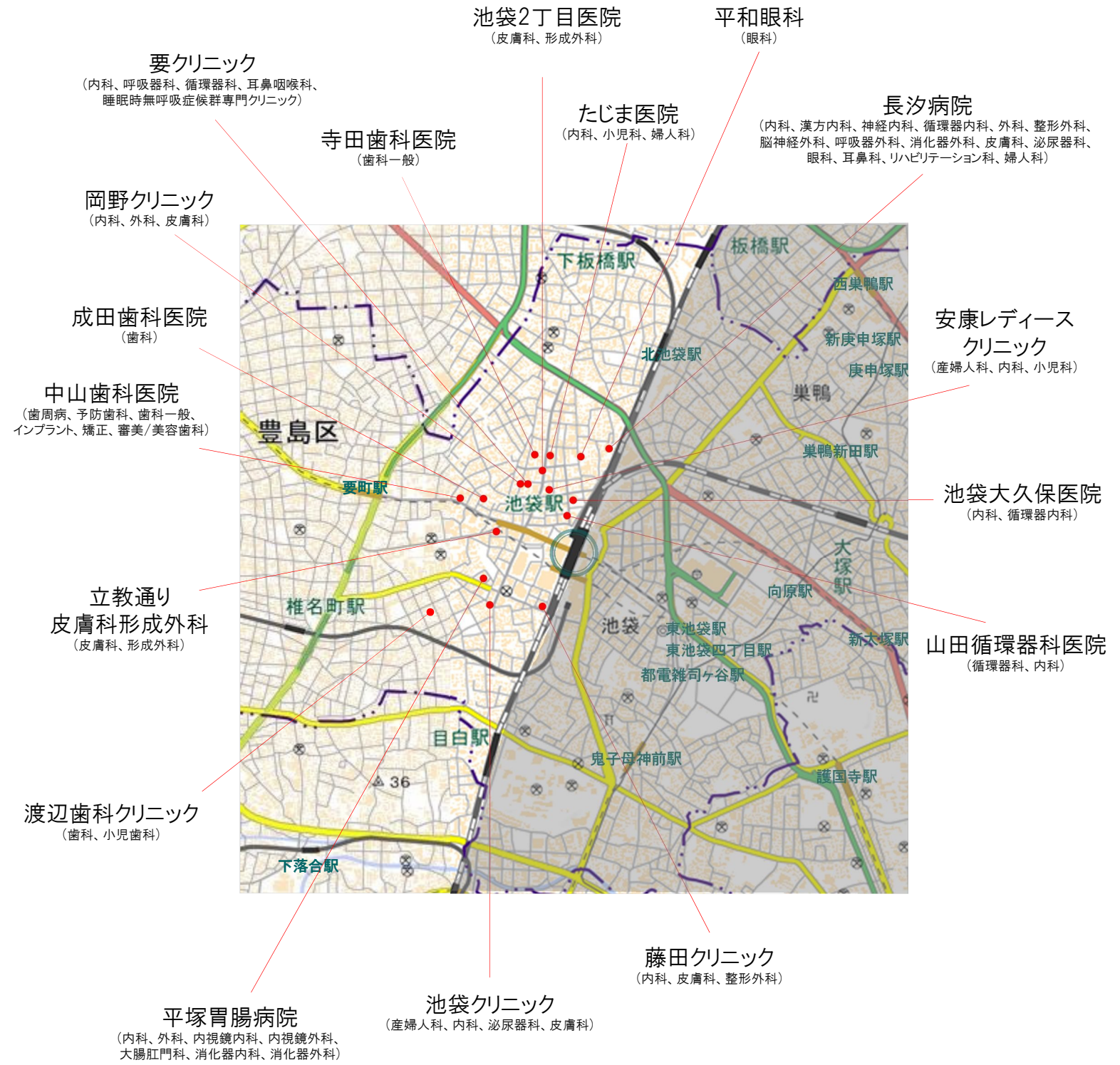
国土地理院の電子地形図(タイル)に連携医療機関の位置情報を追記して掲載しております