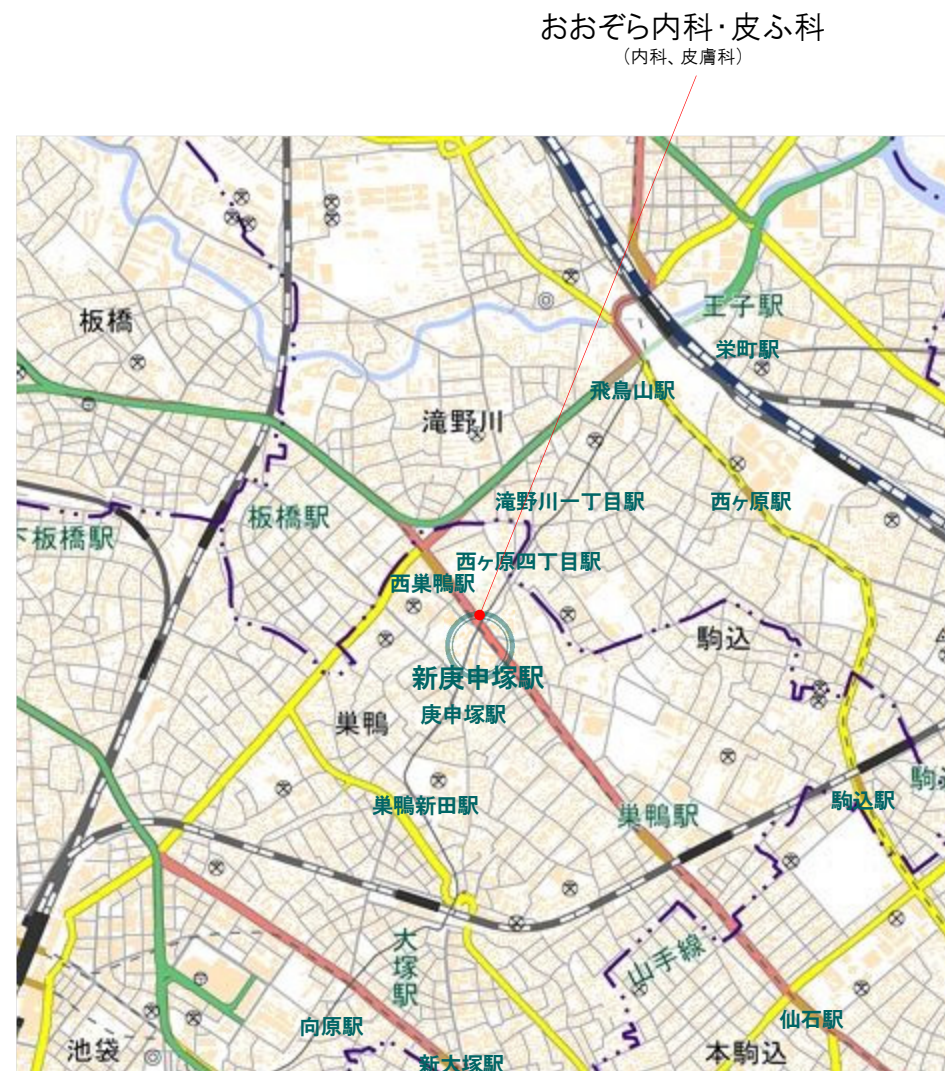
おおぞら内科・皮ふ科 (内科、皮膚科)