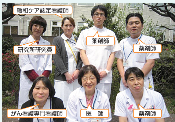
緩和ケア内科チーム

緩和ケア内科では、医療職（医師・看護師・薬剤師、その他の医療職）からの緩和ケア相談を受け付けております。緩和ケアについてのご相談は、医療連携室までご連絡ください。