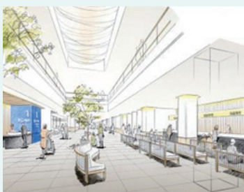
見わたせる外来モール

トイレは、外来エリアに多目的トイレを複数整備し、介助を必要とされる方をサポートしやすいスペースを確保するほか、汚物流し、大型ベッドの設置などを検討しています。