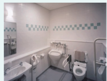
高齢者・身障者に配慮したトイレ