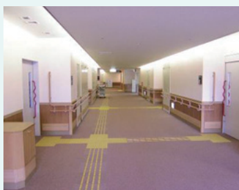
移動しやすい屋内通路