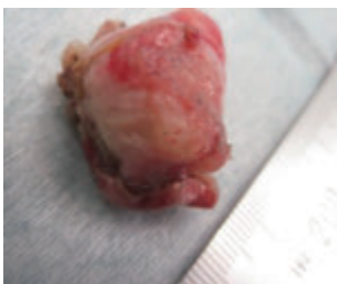
写真① 漿膜側に突出する GIST(消化管間質腫瘍)