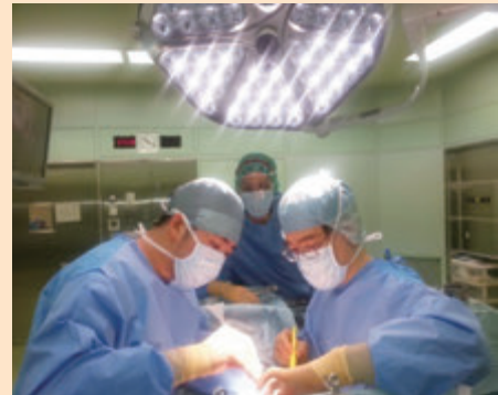
外科手術中の風景