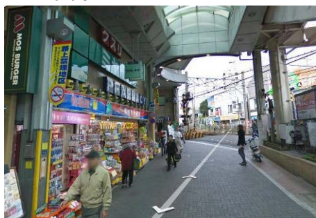
踏切(写真奥)をわたってください