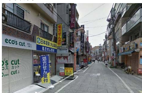
大山薬局のコーナーを左に曲がってください