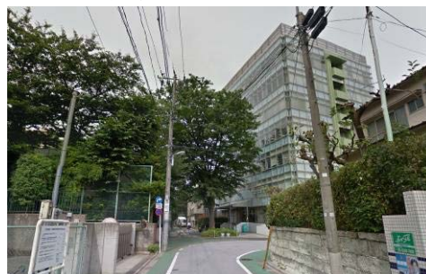
グリーンホール(写真右奥)の前の小道をそのまま進んでくださいその後、大通りに出ます