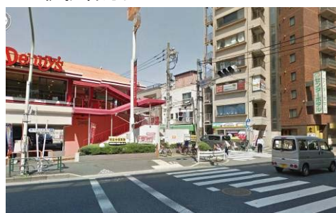
デニーズとセンターホテルの間の道を進んでください