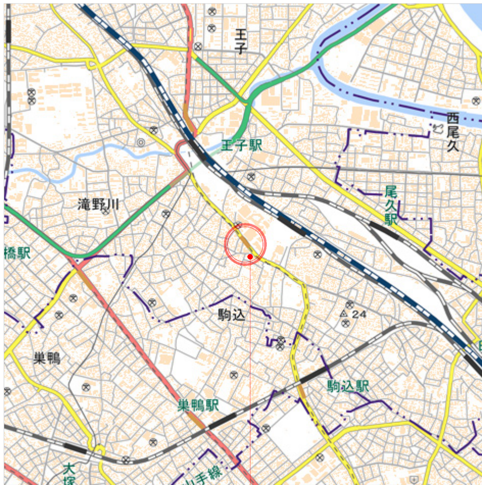
小峰クリニック (精神科)