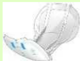
【③紙おむつパンツタイプ】 【④尿取りパッドパンツ用】