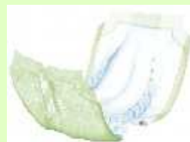
【①紙おむつテープタイプ】 【②尿取りパッドテープ用】