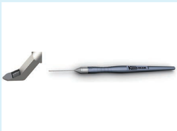
カフークデュアルブレード