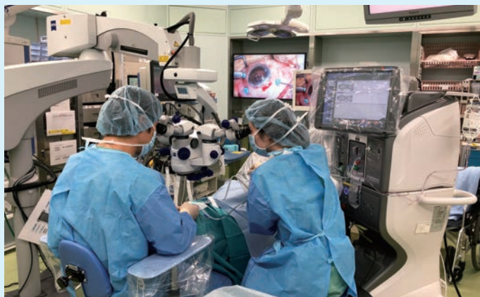
手術風景（硝子体手術）