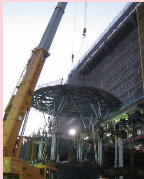
「澁澤サロン」屋根据付の様子

本作業をもってすべての建屋が上棟し、いよいよ全館で内装工事を中心とした仕上げ工程に入ります。