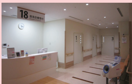
救急外来受付・診察室