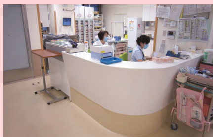
ナースステーション