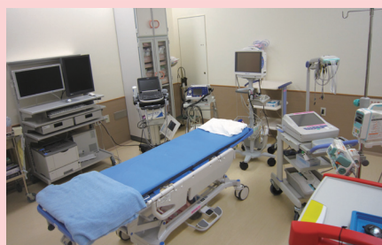
救急車専用処置室