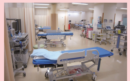
救急外来全体の様子