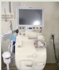
新型透析コンソール

腎機能評価・全身諸臓器の合併症評価・栄養指導を組み合わせた、総合的検査・教育入院プラン「慢性腎臓病パス（腎パス）」を行います（3泊4日、近日中開設予定）。